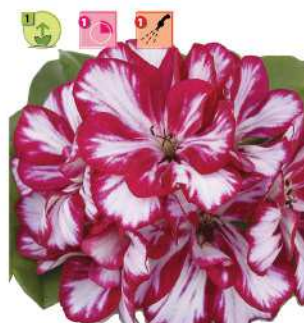
Doblino® Magenta Bicolore

Végétation compacte, floraison très précoce. Var. Gercevis*