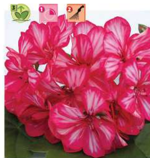
Doblino® Framboise Bicolore

Végétation forte, grande fleur. Var. Gerdoibra*