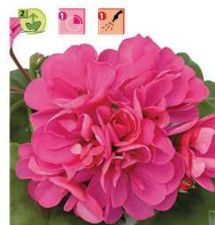
Doblino® Rose Foncé