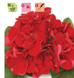
Doblino® Rouge Foncé