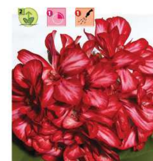
Doblino® Rouge Foncé Bicolore