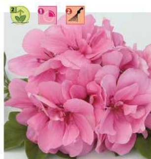
Doblino® Rose Clair