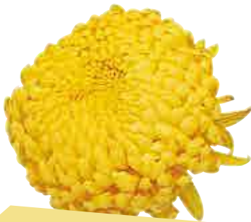
Sir Louissette jaune