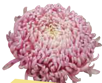
Rosée d'une nuit® rose