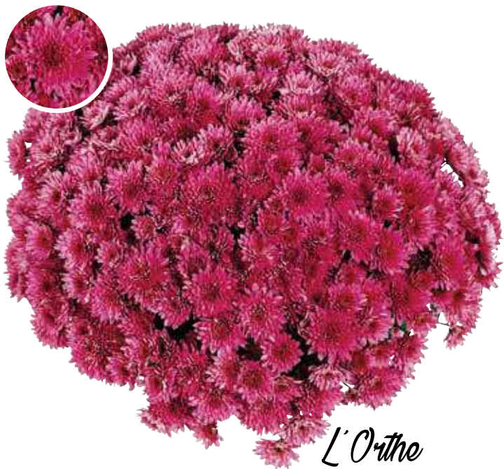
L'Orthe Var. SAUORT c.o.v.*

Violet Port : souple Fleur : double Diamètre : 55-60 cm Floraison : S42 Pincement : sans