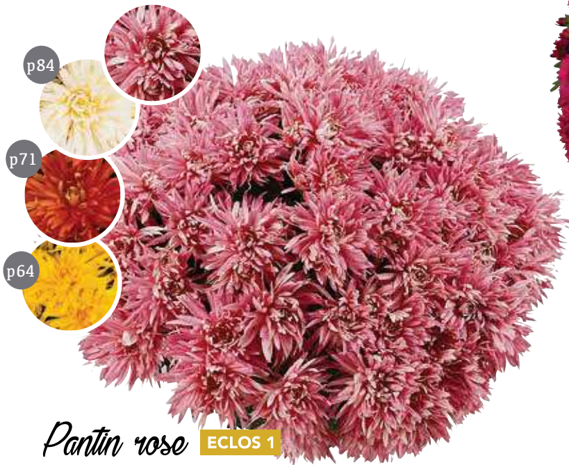
Pantin rose ECLOS 1 Var. CUEWOT

Rose Port : semi-souple Fleur : grande et double Diamètre : 65-70 cm Floraison : S41-42 Pincement : D.P. 20/08