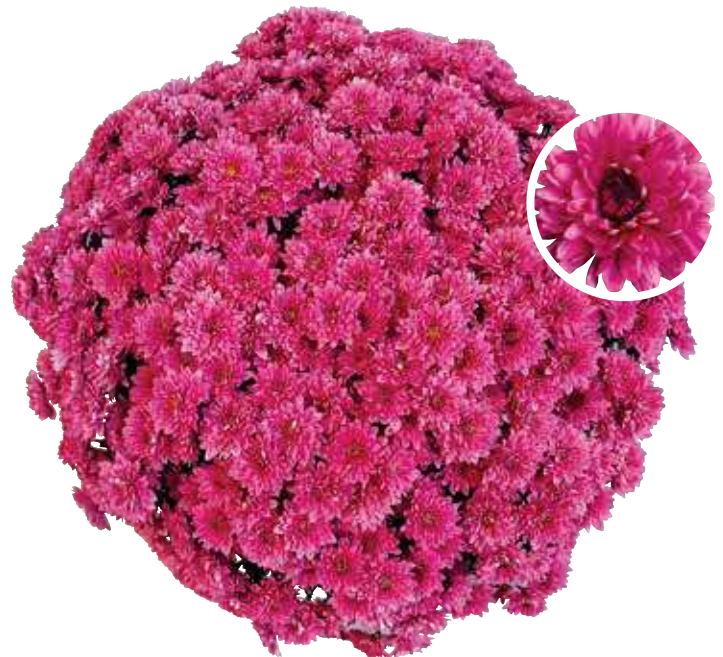
Babzi ECLOS 1 Var. MIGLAZIB

Parme Fleur : double Diamètre : 50 cm Floraison : S42 Pincement : sans