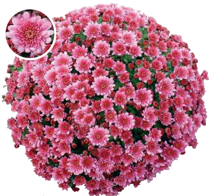
Vent des Ardennes Rose