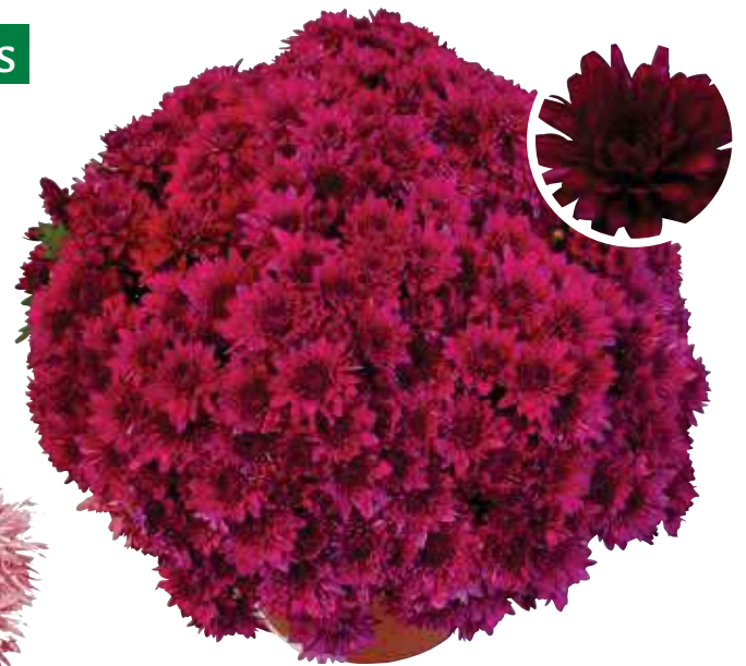
Naline ® Var. MIGLINA

Rose Port : semi-souple Fleur : grande et double Diamètre : 65-70 cm Floraison : S41-42 Pincement : D.P. 20/08