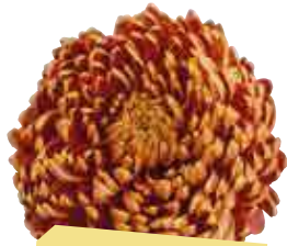
• Roi Johnny®