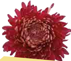
• Romy bordeaux