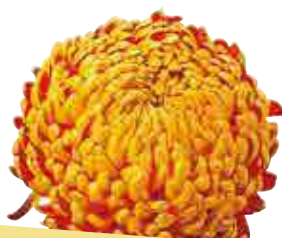
Passionnement® rouge et or