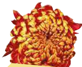
• Succès rouge et or