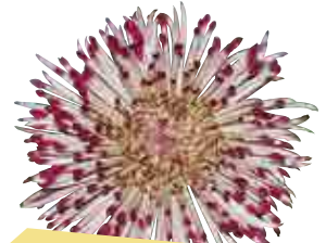
• Santosh rouge