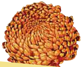
• Sir de Louissette® cuivre