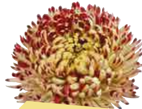
• Santosh doré