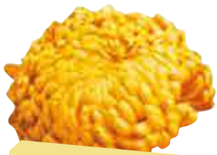
• Passionnément® cuivre