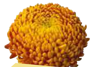
• Victorio cuivre

Tableaux de plantation théoriques, tenir compte des conditions culturales et de la région.