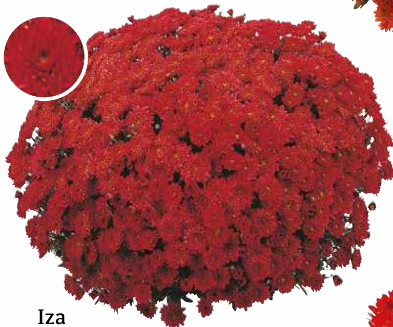
Iza Var. GUITIZA c.o.v.*

Rouge Port : souple Fleur : alvéolée Diamètre : 55-60 cm Floraison : S42 Pincement : avec ou sans Caract. : fleur remarquable mutation de la variété Touchka