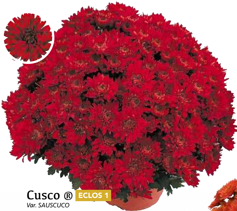
Cusco ® ECLOS 1 Var. SAUSUCO

Rouge vif Port : souple Fleur : grand et double Diamètre : 55 cm Floraison : S41-42 Pincement : sans